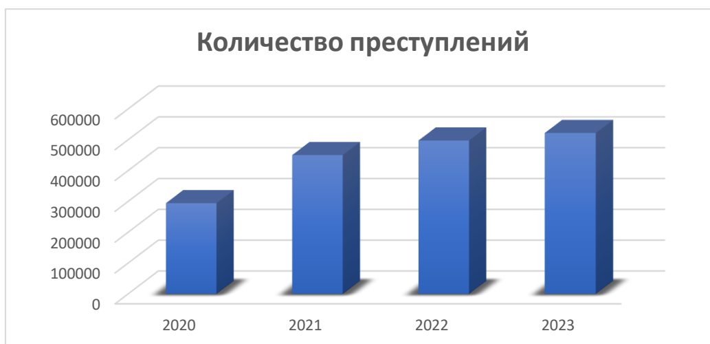
Диаграмма на тему «Количество киберпреступлений в Российской Федерации с 2020 по 2023 г.»