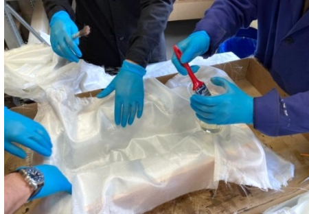
Рисунок 1 – Использование полимера и стеклоткани

Таким образом, была отработана технология изготовления лёгкого корпуса для ТНПА из композитных материалов. Также хочется отметить, что это требует определённых навыков и знаний, и при правильном выполнении всех шагов можно получить качественный и прочный корпус.