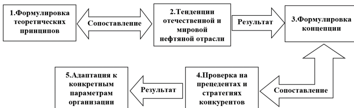
Рис. 1. Алгоритм разработки стратегии организации

Опираясь на вышесказанное, теоретические принципы, которые необходимо положить в основу концепции устойчивого развития любой отечественной вертикально-интегрированной нефтяной компании следующие: