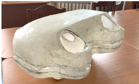
Рисунок 2 – Готовый образец лёгкого корпуса